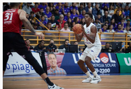
Brasil estreia na Copa do Mundo de Basquete no dia 26 de agosto, contra o Irã