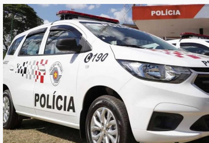
Homem de 53 anos é baleado em sua casa no Jardim Santa Bárbara